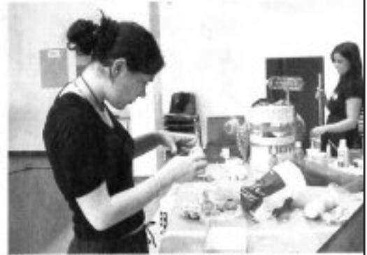
Una formatrice volontaria prepara le attività da proporre ai giovani.